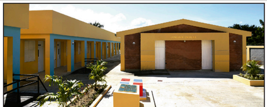
Escuela Básica Profesor Daniel Mercedes Rosario (Las Jaguas, Las Matas de Farfán)