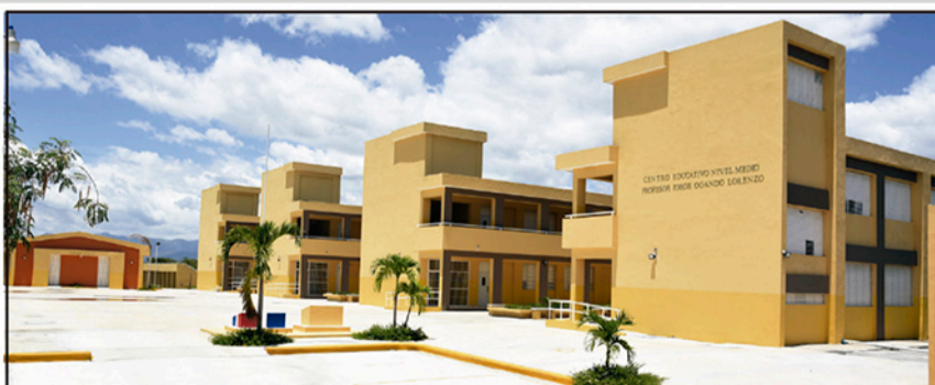
Liceo Profesor Jorge Ogando Lorenzo (Las Matas de Farfán)