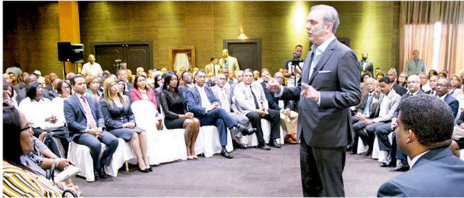
Luis Abinader habló ante cientos de abogados que lo apoyan.

PRM. El precandidato presidencial del Partido Revolucionario Moderno (PRM), Luis Abinader, afirmó que en la actual coyuntura el país está ante una excelente oportunidad para dar inicio a un proceso de renovación del sistema de justicia.