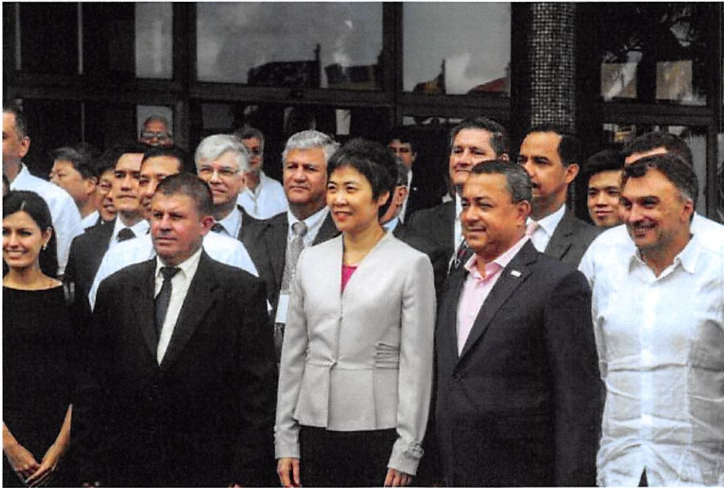
Foto oficial de los participantes en la Asamblea Ordinaria de la Comisión Latinoamericana de la Aviación Civil, durante la clausura del evento, realizado en el Hotel Meliá Cohíba, en La Habana, Cuba, el 21 de noviembre de 2018.