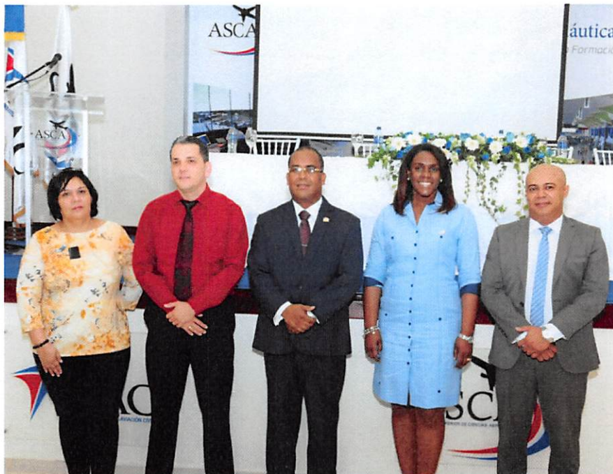
Firma internacional realizó auditoría de seguimiento a las certificaciones ISO y OHSAS del IDAC