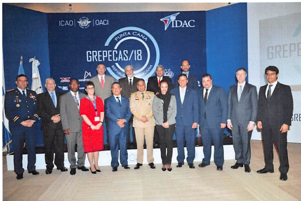
El director general del IDAC durante el brindis de recibimiento a los participantes en Grepecas 2018.