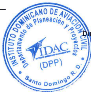
Yildis Almonte Directora de Planificación y Desarrollo